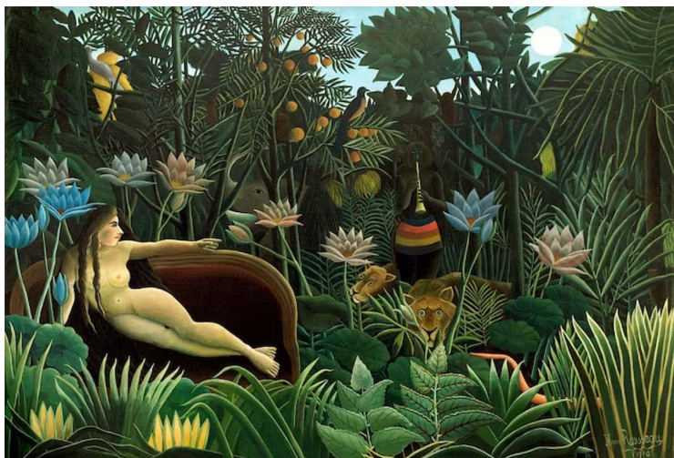
« Le Rêve », Le Douanier Rousseau

Choisissez le tableau qui vous semble correspondre le mieux à l'ailleurs décrit dans la chanson. Justifiez votre choix.