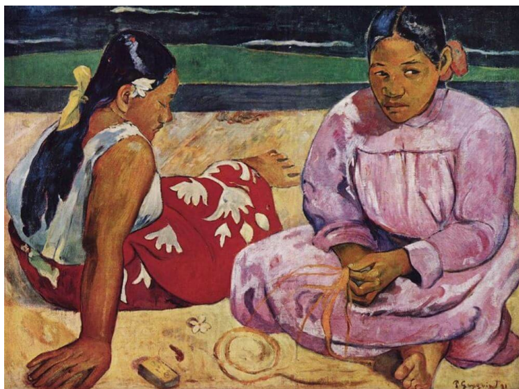
« Femmes de Tahiti », Paul Gauguin https://www.carredartistes.com/